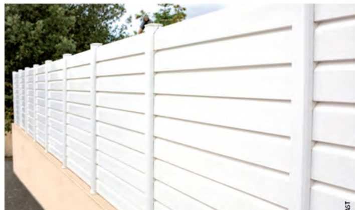
Ci dessus : CLOTURE SISTA PVC Plaxé Coton

Pour satisfaire vos exigences et vos attentes, et parce que c'est la passion de Geplast, ils en font un devoir de vous proposer sans cesse les dernières innovations en matière de formes, de design et de matériaux. Leur bureau d'études travaille dans ce sens, auprès de tous les professionnels du bâtiment. Dans sa gamme Outdoor, Geplast vous propose différents produits : la terrasse, le portail et la clôture.