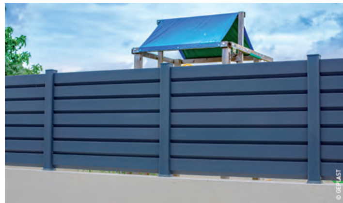
Ci dessous : CLOTURE SISTA Plaxé Ardoise