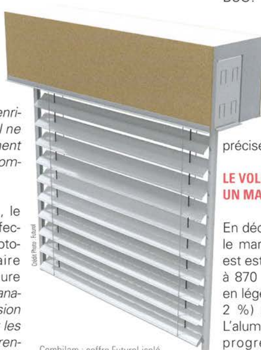
Combilam : coffre Futurol isolé en polystyrène revêtu à l'extérieur d'une plaque en Fibragglo à enduire

En déclin sur le long terme, le marché du volet battant est estimé par MSI Reports à 870 000 unités en 2017, en légère progression (+1 à 2 %) par rapport à 2016. L'aluminium (47 % du total) progresse au détriment du bois et du PVC. Présent avec les trois matériaux,